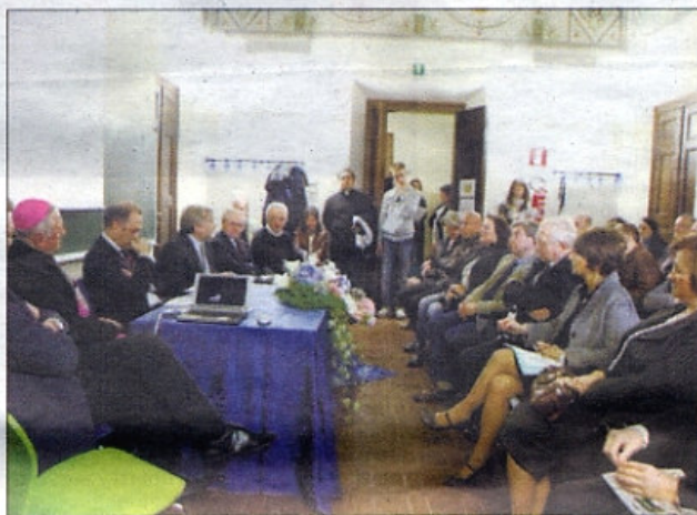
PRIMARIE DEL PD